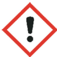
GHS07 Hasło ostrzegawcze: